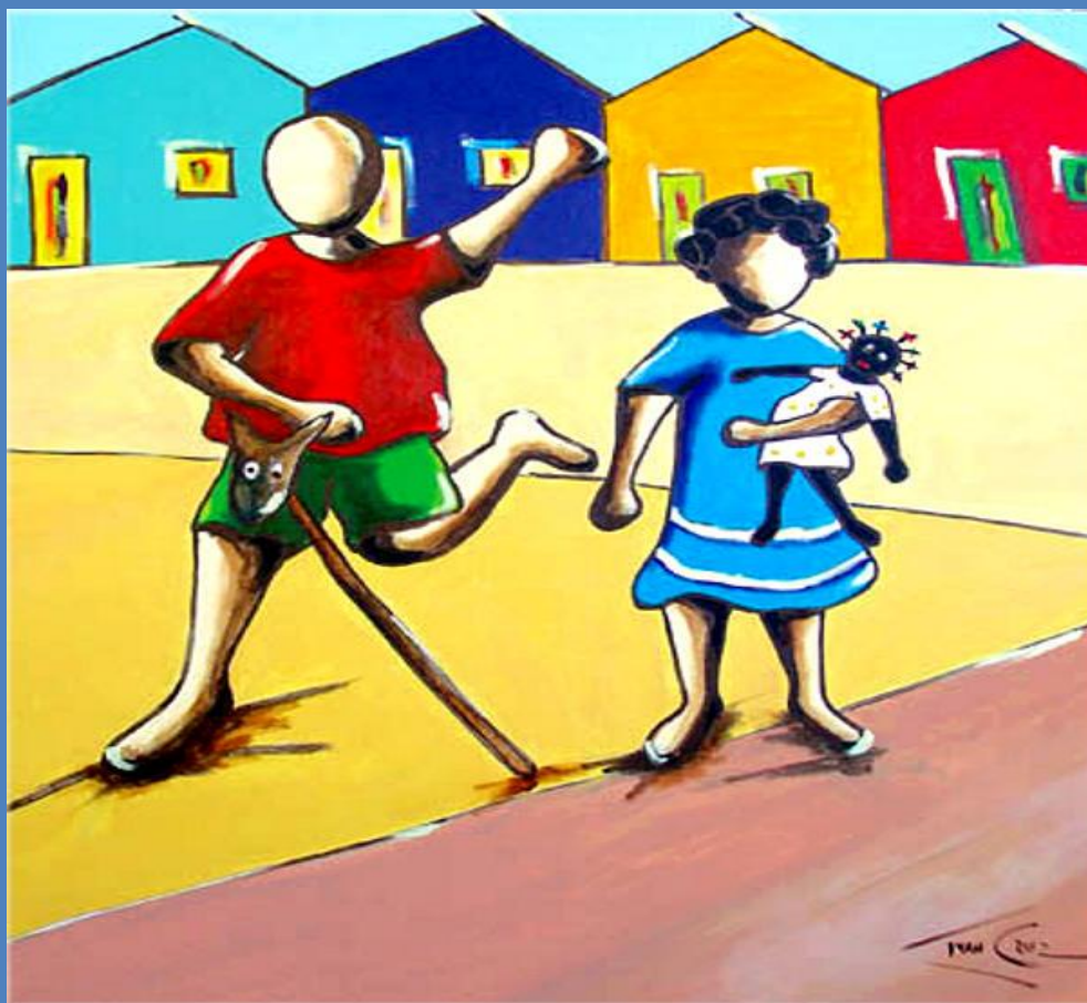
CAVALINHO E BONECA