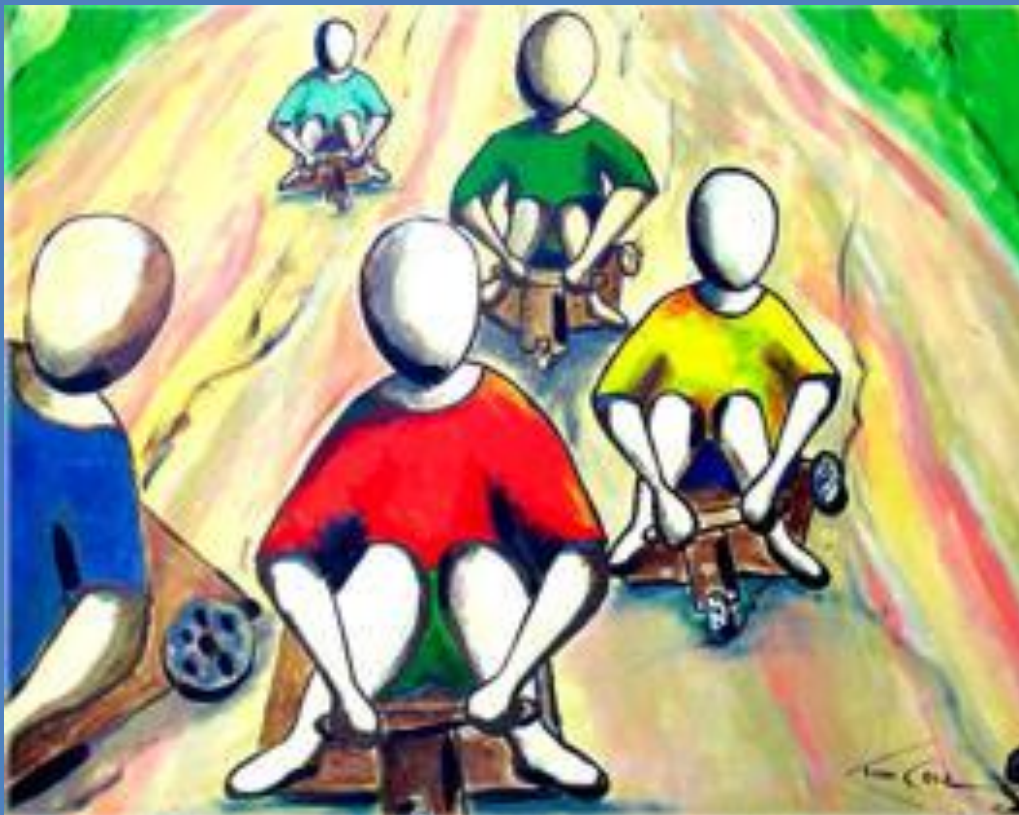
CORRIDA DE ROLIMÃ