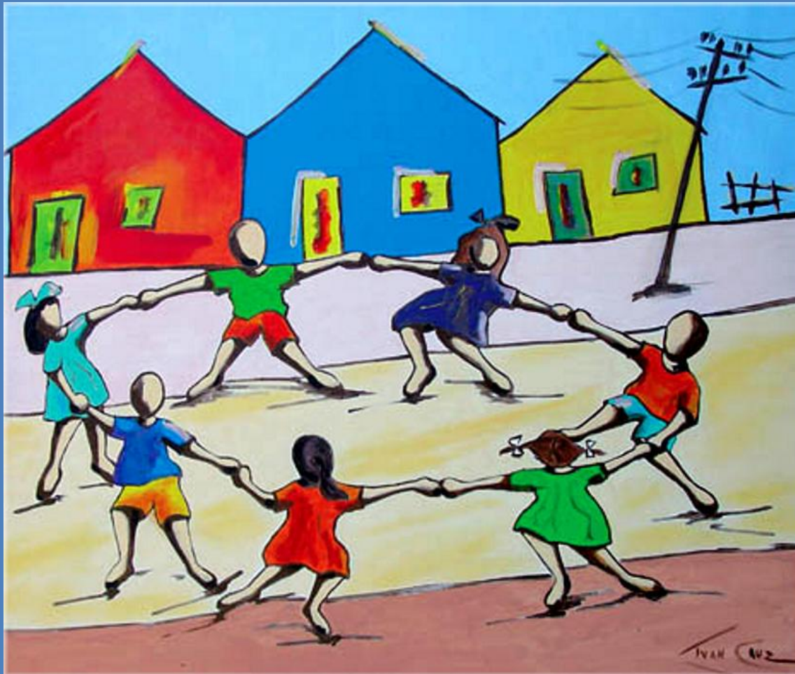
BRINCANDO DE RODA