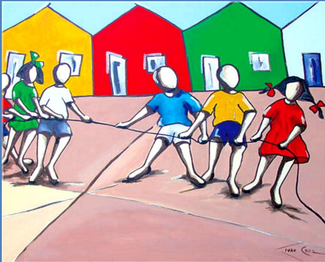
CABO DE GUERRA