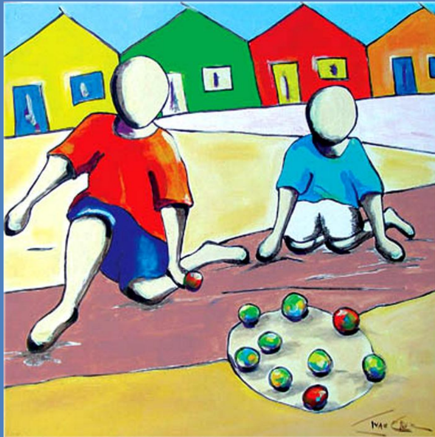
BOLA DE GUDE