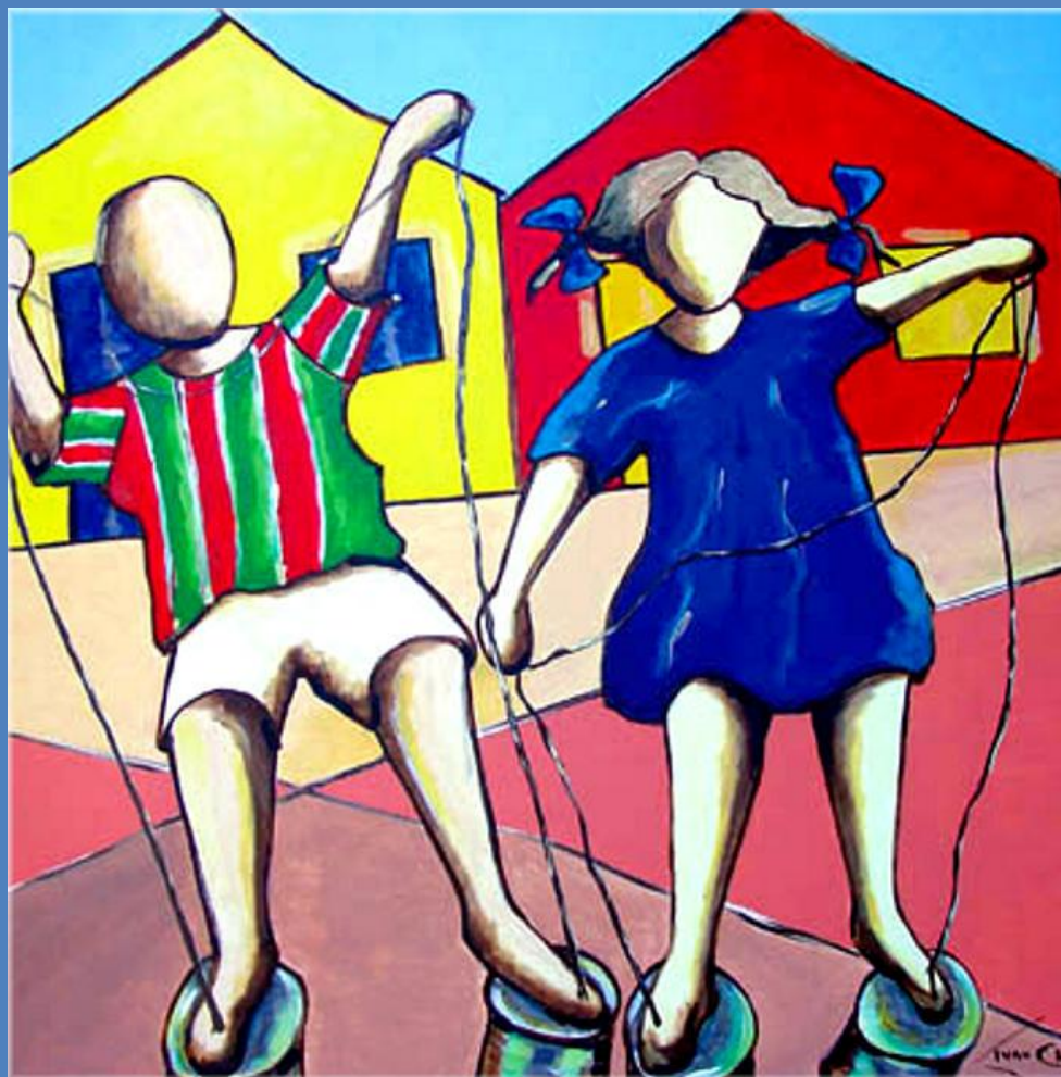
PÉ DE LATA