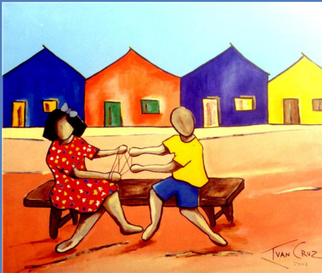
CAMA DE GATO