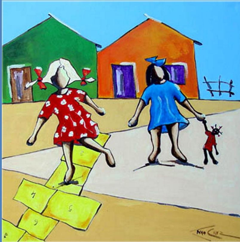
AMARELINHA E BONECA